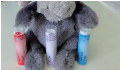
le remède est répertorié de manière individuelle