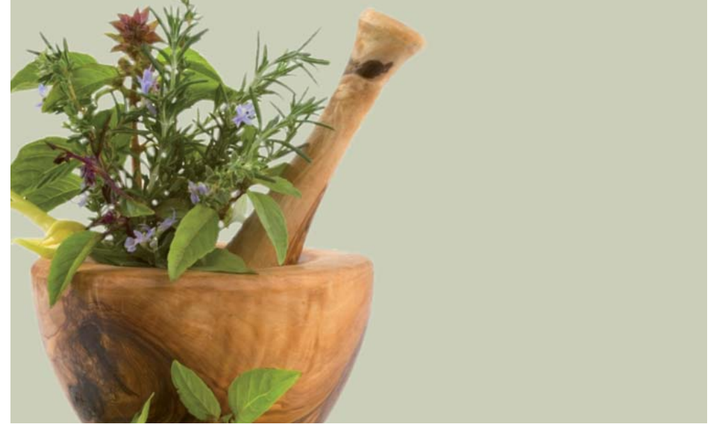
préparation d'un remède homéopathique (trituration)