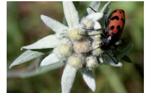
même notre edelweiss peut être utilisée comme remède homéopathique

L'homéopathe tire ses remèdes des 3 règnes: minéral, végétal et animal. Ses remèdes sont préparés par dilutions (hahnemannienne: DH (au dixième) ou CH (au centième); Korsakovienne: K), dynamisés puis conditionnés sous diverses formes (globules, granules, solutions, comprimés, injectables).