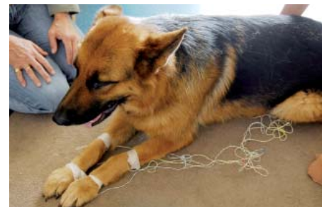
rééquilibrage des énergies par des fils conducteurs (acupuncture japonaise)