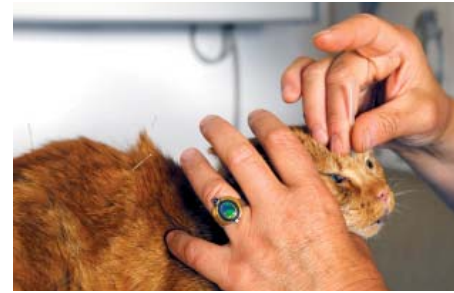
traitement d'un chat (acupuncture chinoise)